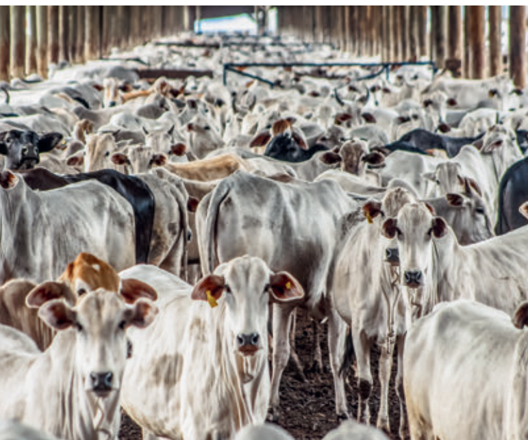
Typische Tierhaltung in den Mercosurstaaten

Darin sah ich nun wirklich keinen Sinn. Die Mercosurstaaten – Brasilien, Argentinien, Paraguay, Uruguay – produzieren unter ganz anderen Bedingungen als wir. Ihre Produktionskosten sind viel tiefer, so dass wir in der direkten Konkurrenz nicht mithalten können. Alles steht und fällt deshalb mit dem Verhandlungswillen und -taktik. Der Grenzschatz ist für uns existenziell.